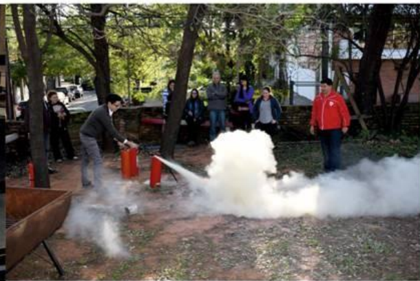
A cargo de la jefatura de seguridad, un técnico de la empresa PROTINPAR realizó una capacitación sobre el uso y manejo de extinguidores a docentes del área de inglés.