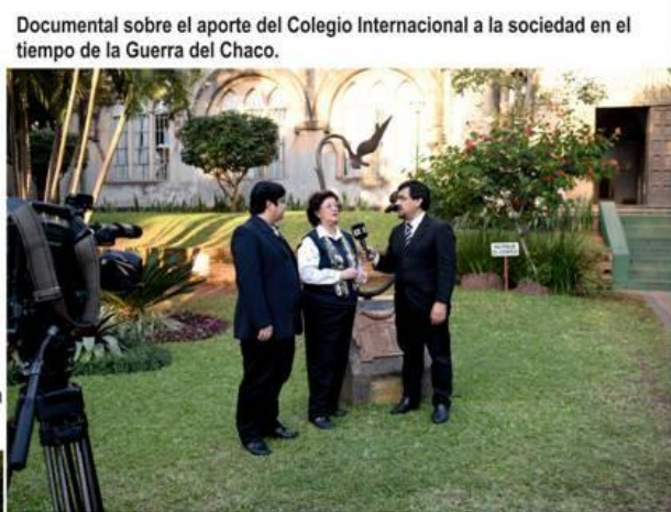
Documental sobre el aporte del Colegio Internacional a la sociedad en el tiempo de la Guerra del Chaco.