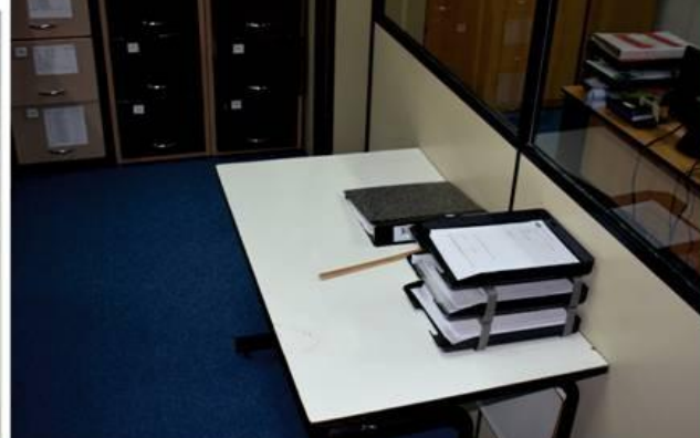
Se realizaron mejoras en algunos espacios pedagógicos, como el alfombrado del Equipo Técnico Pedagógico de N.M. Las mejoras continuarán.