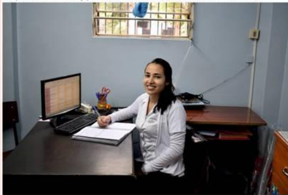
Las tres enfermerías (Nivel Inicial, 1° y 2° Ciclo y Nivel Medio) fueron equipadas con computadoras para que las consultas se registren en planillas digitales.